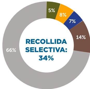
MUNICIPIS CONSORCIATS AMB CONTENIDORS D'APORTACIÓ VOLUNTÀRIA